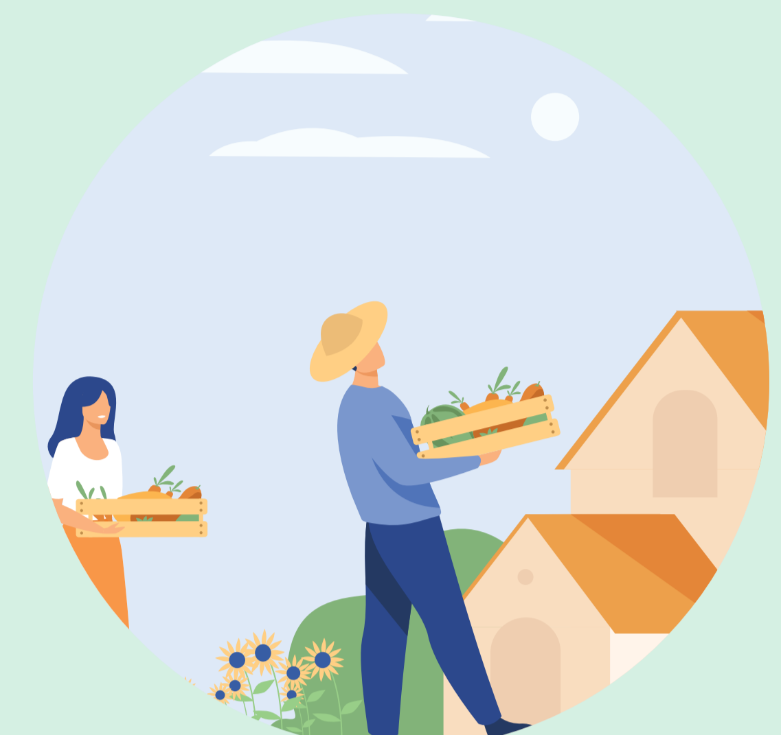
Personas que viven cerca de cultivos