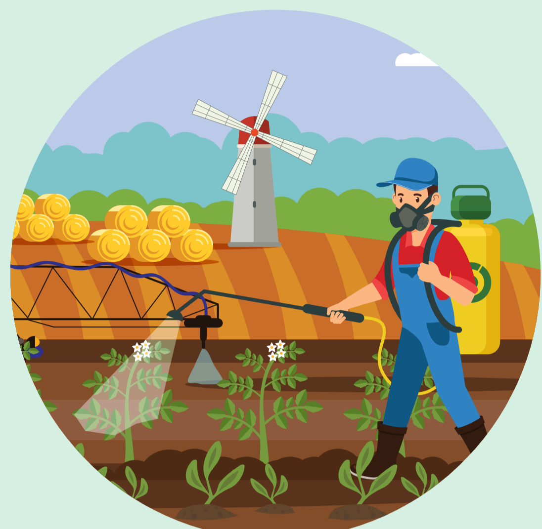
Agricultores y sus familias