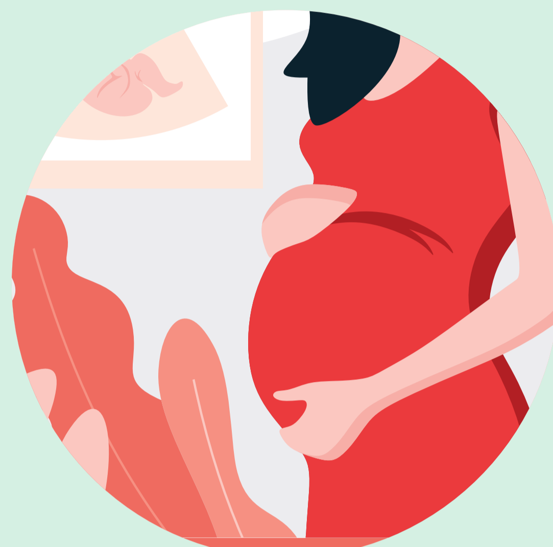
Fetos, bebés y niños pequeños