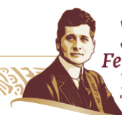
Imágenes 6 y 7. ENPA

2024 AÑO DE Felipe Carrillo PUERTO REMEMORANDO EL PROLETARIADO, REVOLUCIONARIO Y DEFENSOR DEL MAYOR