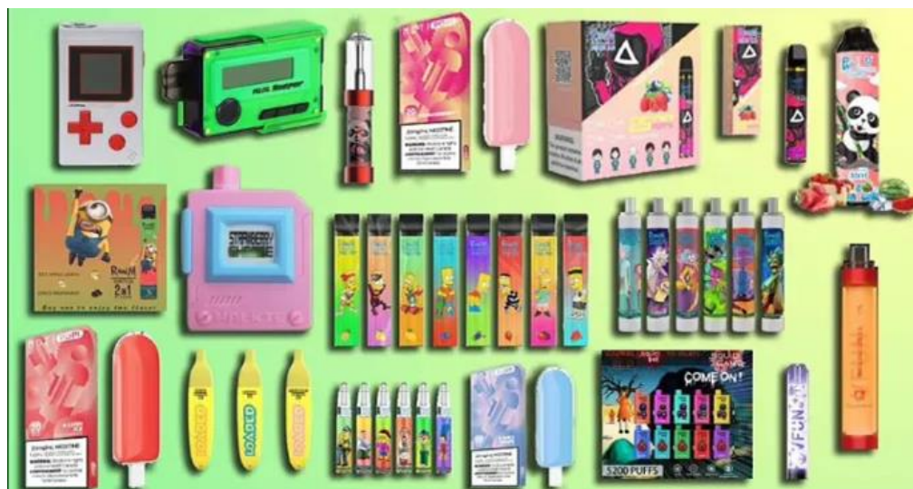
Imagen 1. Diversas presentaciones de los cigarros electrónicos.

Aunque se cree que no era el propósito inicial, ya que estos productos estaban dirigidos a población adulta como una supuesta alternativa para dejar de fumar, los productos novedosos y emergentes de tabaco están diseñados y tienen ciertas características que los hacen atractivos y versátiles para la población más joven.