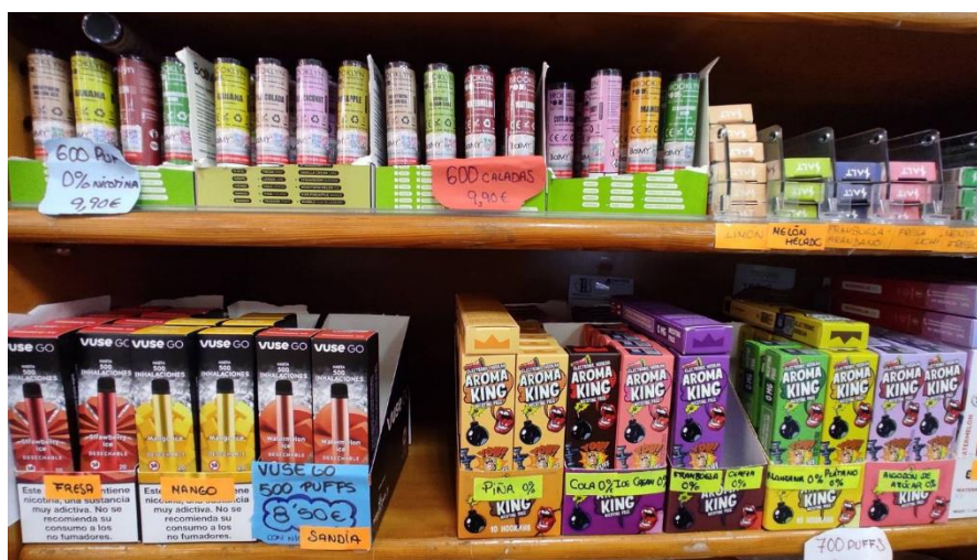
Imagen 3. Variedad de saborizantes para los cigarros electrónicos.

En cuanto al contenido de los productos novedosos y emergentes de tabaco, la IT se ha dado a la tarea de ofrecer alternativas para que estos productos se perciban versátiles. Como se mencionó en la sección previa, a los cigarros electrónicos se les pueden adicionar endulzantes saborizantes como la vainilla, miel, especias, hierbas, chocolate, etc.; asegurándose así de captar la atención de la población más joven.