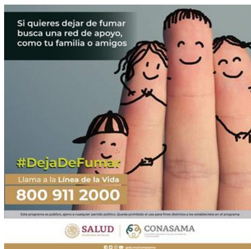
Imagen 8. Servicios de cesación del consumo de tabaco, La Línea de la Vida

La CONASAMA cuenta con una línea telefónica con cobertura en todo el país: “ Línea de la Vida ”: 800 911 2000, es gratuita y está disponible las 24 horas, los 365 días del año, donde se brinda información sobre salud mental y adicciones, atención y referencia oportuna en casos de tabaquismo.