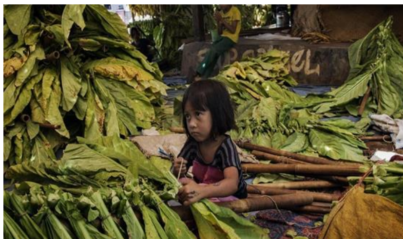
Imagen 5. Niña atando hojas de tabaco en palos para prepararlas para el curado, Islas menores de la Sonda Occidental, Indonesia.