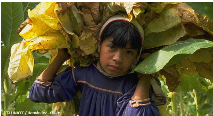
Imagen 4. Niña que trabaja en los campos de tabaco de Nayarit: recolecta las hojas.

Ante este panorama, la IT ha trabajado en promover una falsa impresión de que lucha en contra del trabajo infantil emprendiendo las llamadas iniciativas de responsabilidad social empresarial y autoinformando de sus iniciativas contrarias a la mano de obra infantil. Una de estas iniciativas es la Fundación para la erradicación del trabajo infantil en plantaciones de tabaco (Fundación ECLT), conformada por miembros de los consejos de administración procedentes de British American Tobacco, Imperial Brands y JTI, entre otros. Estas estrategias de la industria están destinadas en gran medida a protegerla de los grupos de defensa de los derechos humanos, ya que sigue saliendo a la luz que millones de niños continúan trabajando en las plantaciones de tabaco.