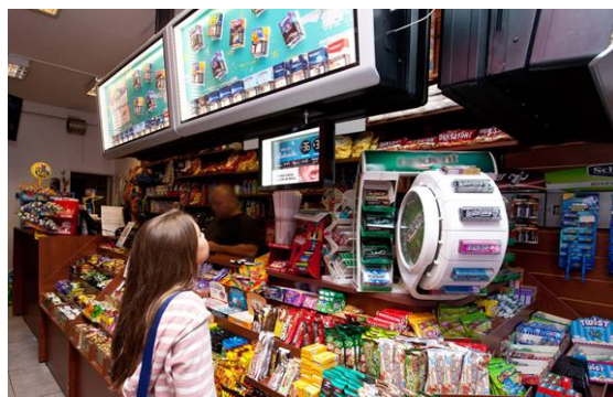
Imagen 2. Exhibición de productos de tabaco en tiendas de conveniencia